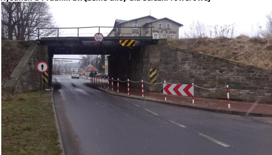
Rysunek 1 Prudnik zwężenie ulicy dla ścieżki rowerowej

biuro@partnerstwo-nyskie2020.pl partnerstwo-nyskie2020.pl