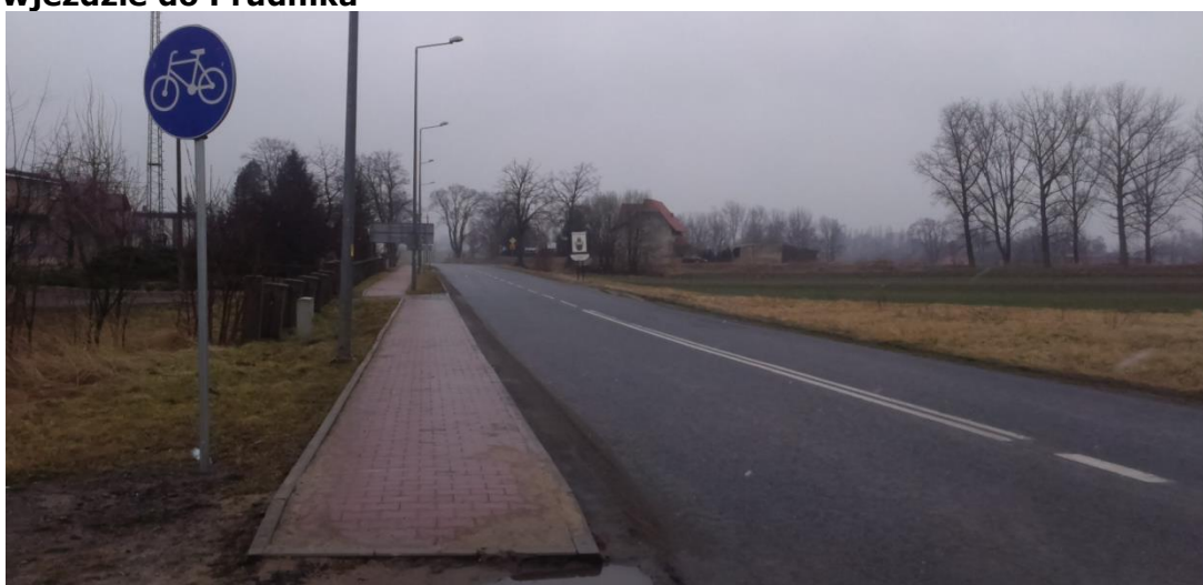
Rysunek 2 Nawierzchnia ścieżki z kostki brukowej na północno-zachodnim wjeździe do Prudnika